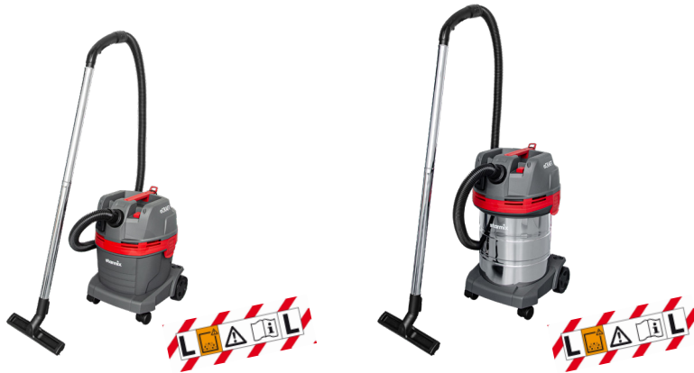
eCRAFT APL-1422 Zum Nass- und Trockensaugen, mit Steckdose für Elektrowerkzeug 22l-Behälter