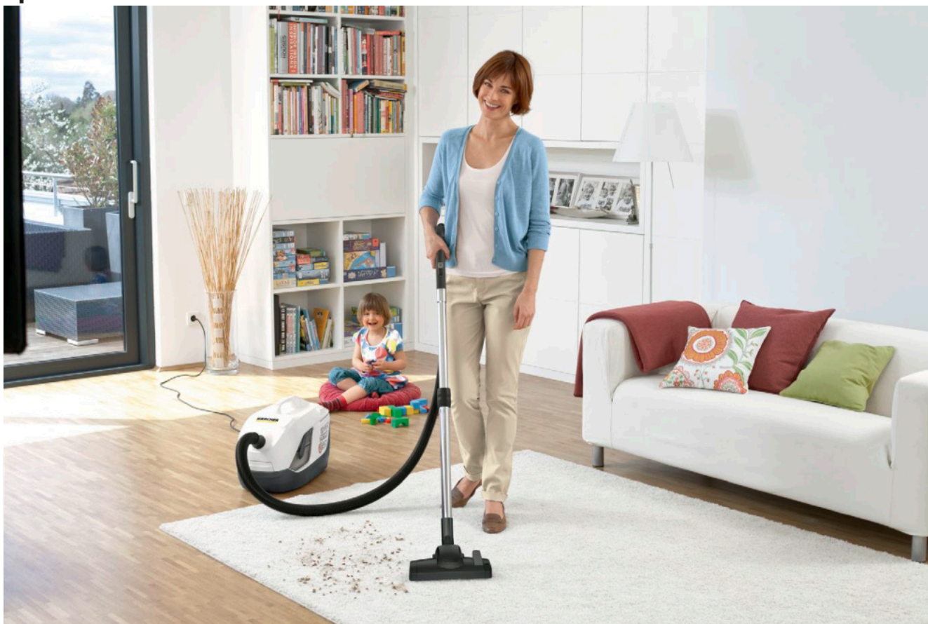
DS 6 Premium Plus