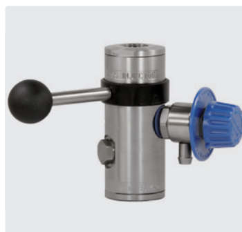
1/2" IG : 1/2" IG : наконечник 9 мм. Инжектор ST-167 с дозирующим вентилем ST-161.