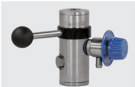
Инжектор ST-167 с Вурасс с дозир. вентилем ST-161 и наконечник 9 мм