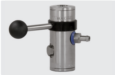
Инжектор ST-167 с Вурасс с наконечником 9 мм