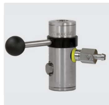
1/2" IG : 1/2" IG : наконечник 9 мм. Инжектор ST-167 с дозирующим вентилем "extreme".