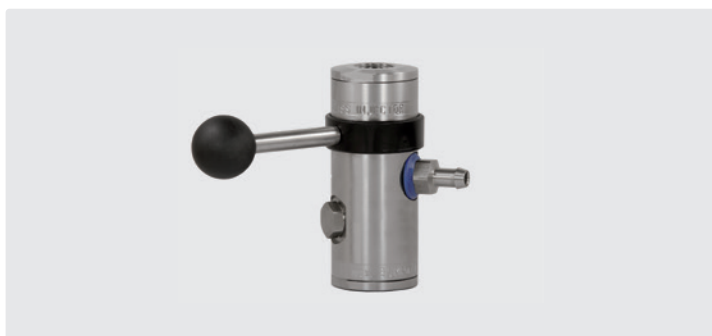
1/2" IG : 1/2" IG : наконечник 9 мм. Регулировка дозирования химии с помощью 10 сменных форсунок (0,5 - 2,0 мм).